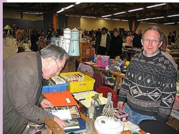
Pas facile de dénicher la bonne affaire ...

Après l'installation des tables et des chaises le samedi matin, le coup d'envoi pouvait être donné ! De 9h à 18h, ce ne sont pas moins de 120 personnes qui