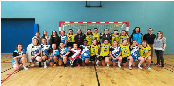
Le handball, sport d'opposition, allie fraternité et convivialité. Ici, les U18 F avec leurs adversaires d'un jour.